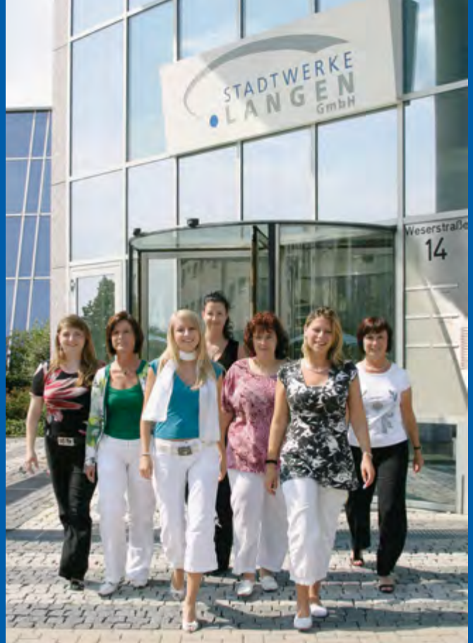
Mitarbeiterinnen genießen ihre neue Heimat