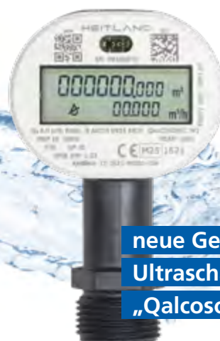
neue Generation Ultraschall-Wasserzähler „Qalcosonic W1“

Der Ultraschall-Hauswasserzähler „Qalcosonic W1“ ist ein echtes Sensibelchen: Er erfasst bereits sehr geringe Wasserentnahmen und kann helfen, undichte Stellen in der häuslichen Trinkwasserleitung aufzuspüren. In Zukunft wird er sich auch in ein Smarthome integrieren lassen, also in eine häusliche Umgebung, in der Haustechnik und Geräte wie Licht, Heizung oder Haushaltsgeräte vernetzt, fernsteuerbar und automatisiert betrieben werden, oft über Smartphone oder Sprachassistent.