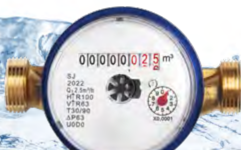
bisheriger Standard Ringkolbenzähler

Die in vielen Haushalten verbauten Wasserzähler in Langen und Egelsbach sind sogenannte Ringkolbenzähler. Sie bestehen aus einem Composite-Material, welches besonders gut recyclingfähig ist, und sind auch bei geringen Durchflussraten ab 6,25 Litern in der Stunde sehr genau. Gegenwärtig werden sie nach und nach durch die Ultraschall-Wasserzähler „Qalcosonic W1“ des Herstellers Axioma ausgetauscht. Diese bestehen ebenfalls aus nachhaltigem Material und erfassen bereits